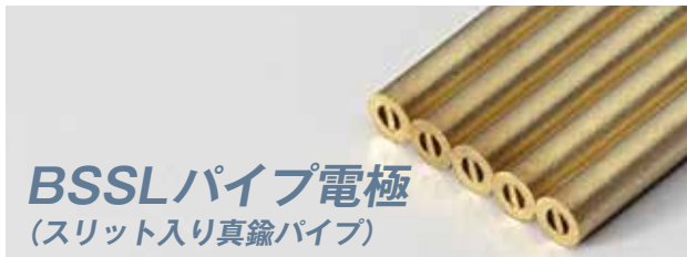
BSSLパイプ電極 (スリット入り真鍮パイプ)