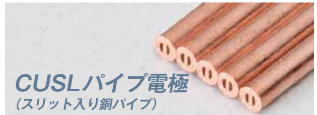
CUSLパイプ電極 (スリット入り銅パイプ)